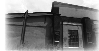
שריד לבית כנסת חב"ד בחרקוב, בו למדו התמימים

בתקופה ההיא, הנדודים בין הישיבות, היו צעד הכרחי. המעקבים והרדיפות, אילצו את ראשי ומנהלי הישיבות, להורות לתמימים לנדוד ממקום אחד למשנהו, בכדי שלא יתפסו חלילה על ידי המשטרה החשאית, וכך המשיך התמים הצעיר לנדוד - מנעול נדד דוד להומיל.