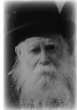
הרב ישראל נח הגדול (בליניצקי)