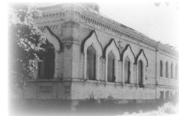
בית כנסת בקרעמנצ'וג בו למדו התמימים