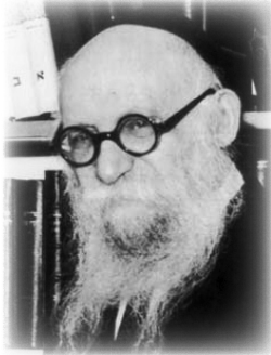
הגאון הרב שלמה יוסף זווין

ביום שישי ומצאו בעזרת נשים חבילות שלנו. סגרו וחתמו את בית הכנסת. במוצאי שבת, בשעה אחת אחר חצות, נכנסנו דרך החלון לקחת את החבילות וברחנו".