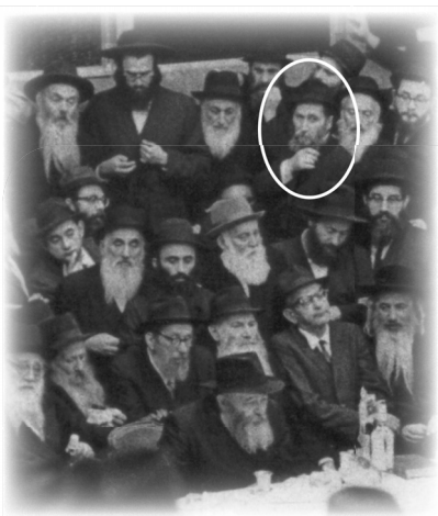
בהתועדות אצל הרבי תשרי תשכ"ח (מסומן בעיגול)