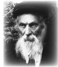
סבו ר' הירשל לא היו קלים, בגלל רדיפות הקומוניסטים. הם גם

פעם בשעת הלימוד נכנס לבית המדרש הרבי נשיא דורנו, שהיה ידוע אז כבנו של הגאון החסיד המקובל הרב לוי יצחק שניאורסאהן רבה של העיר דנייפרופטרובסק, וידעו כי הוא למדן גדול. הבחורים עסקו אז בלימוד מסכת בבא מציעא דף ל' עמוד ב'. במימרתו של רב יוסף על הפסוק "והודעת להם את הדרך ילכו בה (יתרו יח, כ) - והודעת להם - זה בית חייהם, את הדרך - זו גמילות חסדים, ילכו - זה ביקור חולים". שאלו אותו התמימים פשט ברש"י על המקום, שמפרש את המילים זה בית חייהם - "ללמד להם אומנות להתפרנס בו חוקות ותורות כתיבי